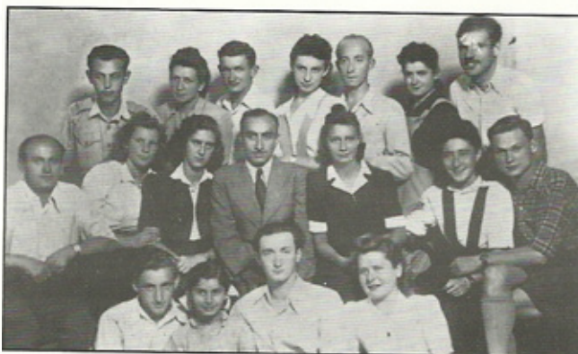
הגרופה בבוקרשט בשנת 1945