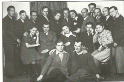
הגרופה בבודפשט בשנת 1943

The group's underground activity continued, with the cooperation of the local Hanoar Hatzioni , and included: purchasing arms, forging Aryan papers, attempting to make contact with Tito's partisans, sending people to Romania – the "Trip" (organized smuggling of Jews to Slovakia and Hungary). Trajman found the route leading through the border city of Nodzvarod.