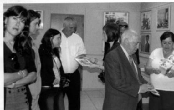
Zdjęcia chasydów i czeladzkie publikacje o tematyce żydowskiej wzbudziły duże zainteresowanie gości z Izraela.