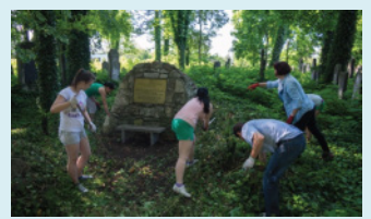
פעולות ניקוי ושימור ע"י נערות המשתתפות בפרויקט