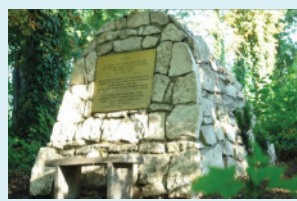
האנדרטה בבית העלמין