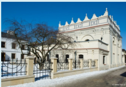
בית הכנסת בזמושץ