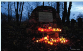
נרות זיכרון לרגלי האנדרטה