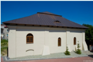
בית הכנסת בקראשניק

בנוסף לפעולותיה בנושא בתי הכנסת ובתי העלמין מעורבת הקרן במגוון תכניות חינוכיות, אירועי תרבות, ובחשיפת ההיסטוריה הארוכה והעשירה של הנוכחות היהודית בפולין. בתחום זה פועלת הקרן בתחום טיולי מורשת יהודית בפולין וניתן למצוא באתר שלה את מפת "נתיב החסידות".