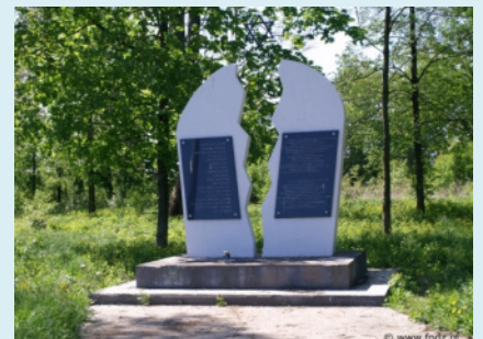
המצבה בוויסוקי מזובייצקי

למידע נוסף אודות הפרויקט "אמץ בית עלמין יהודי"