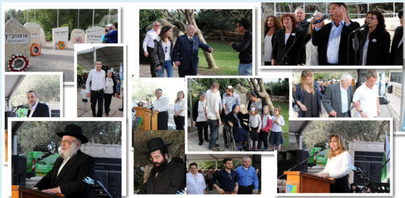
תמונות מטקס יום השואה תשע"ה

יש לי שני נכדים בגילך, ואני מתחייב כי גם הם, ואחרים, יכירו אותך וידעו את סיפור חיך הקצר והעצוב.