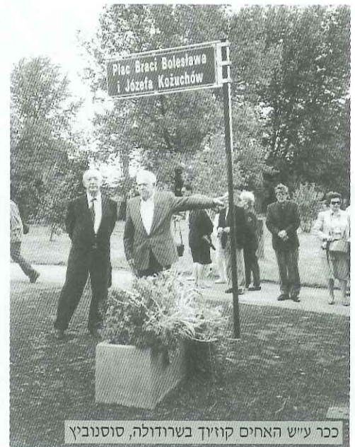
כבר ע"ש האחים קוזיוף בשרודולה, סוסנוביץ

כן, הם התקוממו. התקוממו צעירי בנדין, סוסנוביץ, קטוביץ והסביבה. סגורים בגיטו משותף ניסו הם להילחם, ניסו לנקום, ניסו להציל ולהינצל. כאריות צעירים הרעידו את סורגי כלובם. הם פעלו, למרות שמעשיהם נועדו מראש לכשלון, הם הלכו, כי כך ציווה כבודם. מטורפים! בלי נשק - נלחמו. בלי כסף - השיגו נשק. בסביבה עוינת חיפשו מקלט. הם האמינו בכוכב הטוב שלהם, אך לרובם לא האיר המזל פנים.