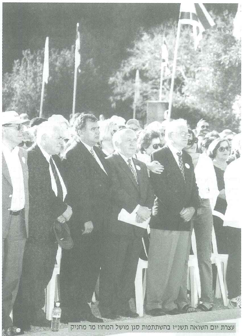
עצרת יום השואה תשנ"ז בהשתתפות סגן מושל המחוז מר מחניק

לצאת מן הבית, כאורחות החיים. להקים משפחה ולהוליד ילדים.