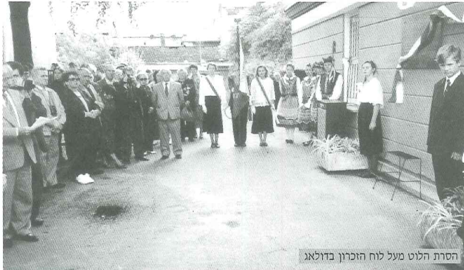
הסרת הלוט מעל לוח הזכרון בדולגה

בן טוב היה איש ציבור מובהק אשר לחם לרווחת ניצולי השואה בארץ. הוא שימש כנשיא העולמי של ארגון יוצאי זגלמביה והיה חלוץ ביצירת הקשרים עם השלטונות המוניציפאליים שבמחוז זגלמביה.